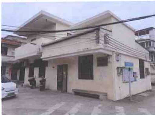
建（构）筑物外观（老人活动中心）