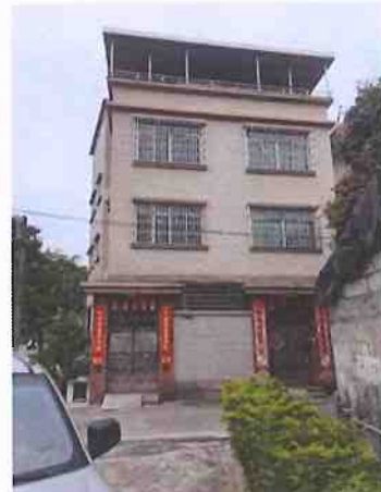
建（构）筑物外观（梁锦洪）