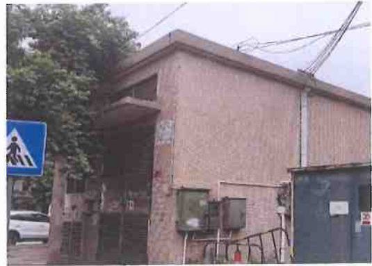
建（构）筑物外观（配电房）