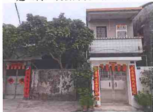
建（构）筑物外观（吴顺锦）