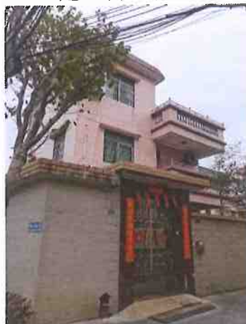
建（构）筑物外观（刘锦光）