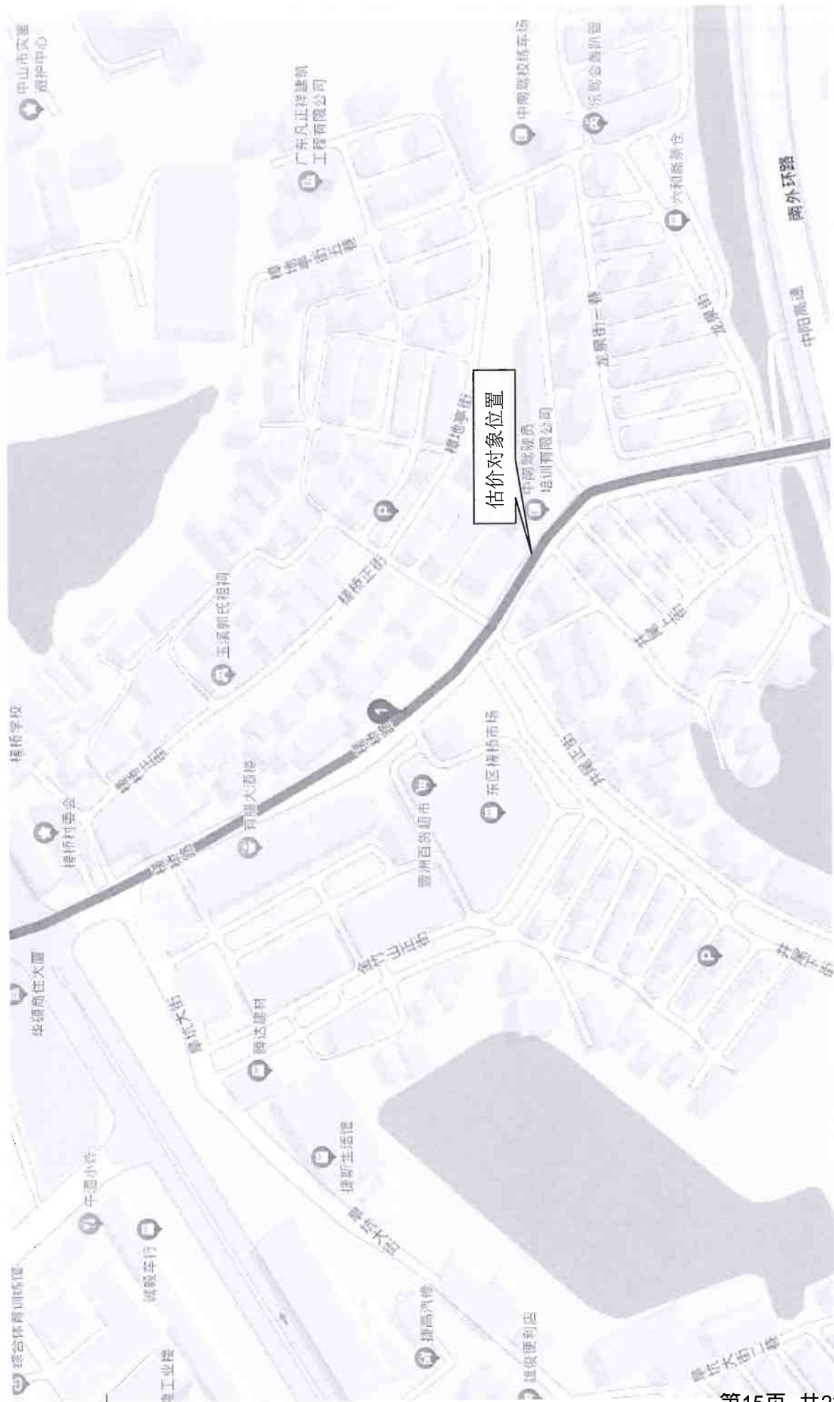
估价对象位置示意图