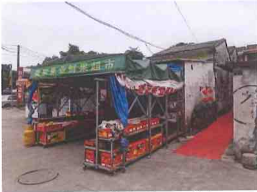
建（构）筑物外观（郭醒如）