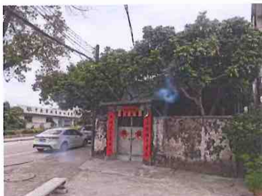
建（构）筑物外观（无资料）